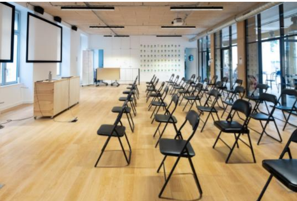
Espace Agora Paris