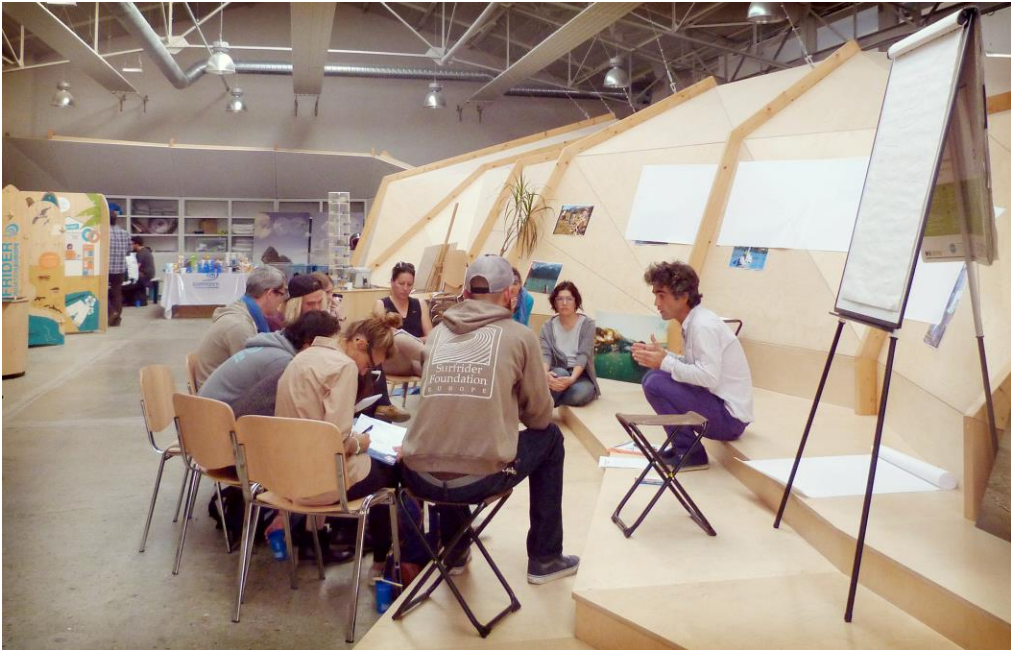
Espace Campus Biarritz