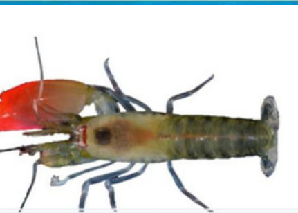
LA CREVETTE PISTOLET