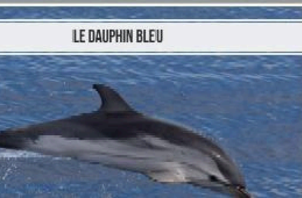
LE DAUPHIN BLEU