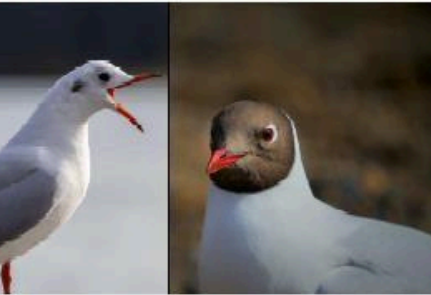
LA MOUETTE RIEUSE