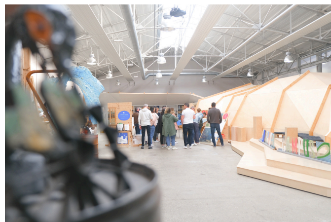
Surfrider Foundation Europe 33 allée du Moura, 64 200 Biarritz